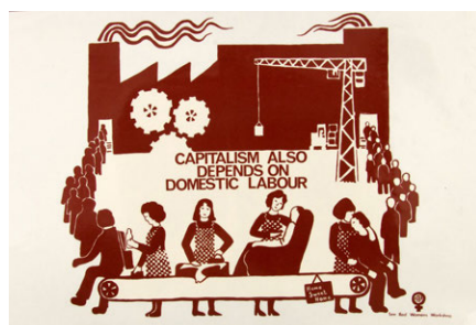
Cartel de See Red Women's Workshop (1975), El capitalismo también depende del trabajo doméstico.

Así, deberíamos buscar formas de cuidado colectivo. Antiguamente, el espacio para el encuentro y la participación ciudadana era la plaza pública –el ágora-. En nuestros días, las plazas se han convertido en espacios para la actividad comercial, el mensaje publicitario y el tráfico. Sin embargo, la nueva ciudadanía empoderada tiene la intención de tomar las plazas y convertirlas en espacios de asamblea, de transformación social y de puesta en común, espacio dónde tejer redes y concebir otros modelos de vida más cuidadosos.