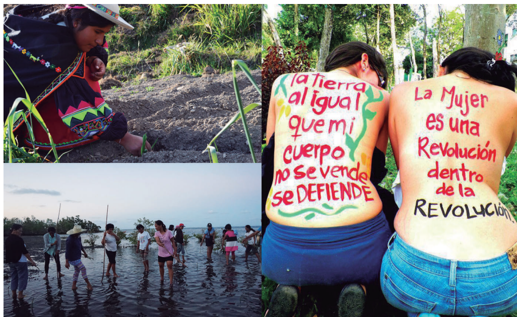
De izquierda a derecha, de arriba abajo: 1.- Formacion agraria. Titichachi, Bolivia. InteRed 2.- Pesca. Bicol – Sorsogon, Filipinas. InteRed 3.- La tierra no se vende se defiende

Como mencionábamos en el primer apartado de este documento, todas estas acciones en las que no priorizamos el bienestar de la naturaleza nos han llevado a estar ante una crisis ecológica nunca vista hasta ahora. Y debido a no priorizar el bienestar colectivo, preocupándonos más por tareas productivas y menos por la reproductivas, llegamos a una crisis de Cuidados. Ante tal crisis, desde muchos movimientos sociales se han generado propuestas teóricas y prácticas que han llevado a repensar nuestras acciones.